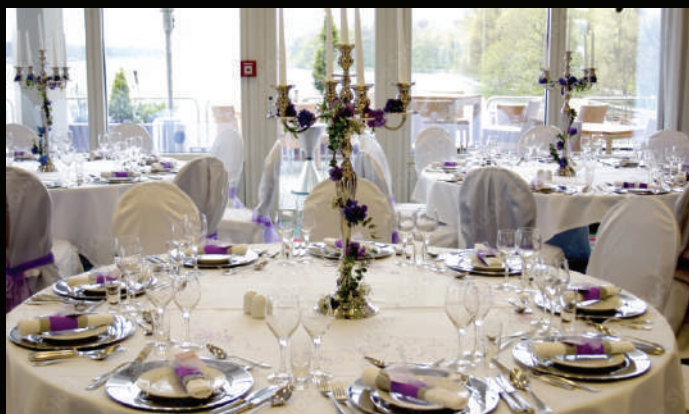
Table ronde, chaise napoléon, nappage, serviette de table, centre de table, chemin de table, assortiment floral artificiel, table des mariés, arche décorative ....

Pour le jour J, notre équipe se charge de préparer la salle et la décoration dans les moindres détails selon vos choix définis au préalable.